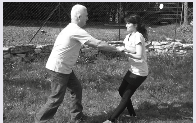
Le treuil est un excellent exercice, très complet, très dynamique, ludique, que l'on peut facilement adapter à son niveau de forme physique, de souplesse, et à son âge.

Le treuil est un mouvement complet ludique, il développe la respiration, la force, l'équilibre, la coordination des gestes et du souffle... A consommer sans modération !